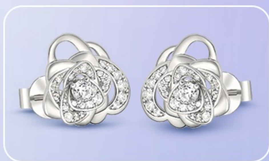
Cách đeo 2