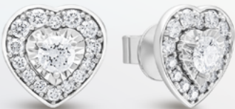
Bông tai GBDDDDW004605 47.149.000Đ