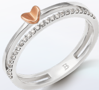
Nhẫn GNDDDDW013463 65.281.000Đ