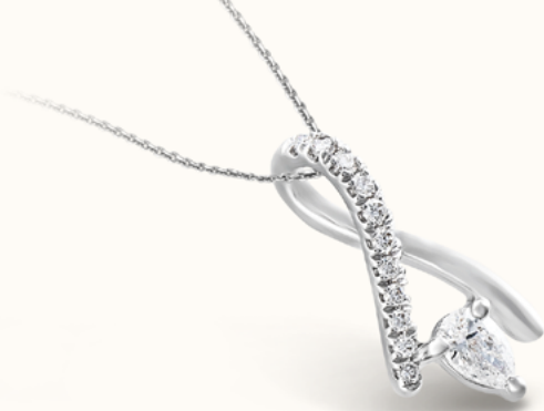
Mặt dây chuyền GMDDDDW060428 8.590.000Đ

Thiết kế tinh giản hòa cùng Kim cương tinh tuyển, gợi ý cho nàng ghi điểm với phong cách thanh lịch.