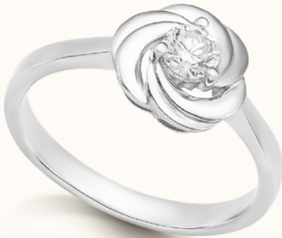
Nhẫn GNDD00W000423 19.782.000Đ