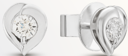
Bông tai GBDD00W000314 14.431.000Đ

Giá bán tham khảo, có thể thay đổi tùy theo trọng lượng sản phẩm