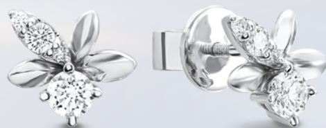
Bông tai GCDDDDW000149 18.749.000Đ