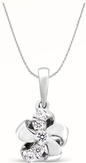
Mặt dây chuyền GMDDDDW060401 7.050.000Đ