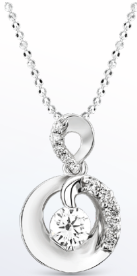
Mặt dây chuyền GMDDDDW000401 24.723.000Đ