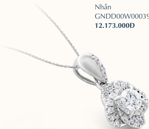
Mặt dây chuyền GMDDDDW060441 33.140.000Đ