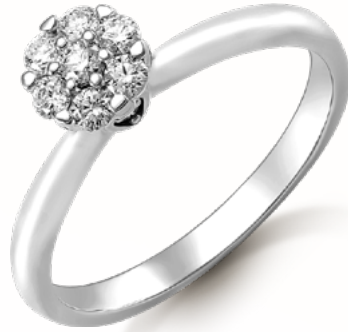
Nhẫn GNDDDDW013463 65.281.000Đ