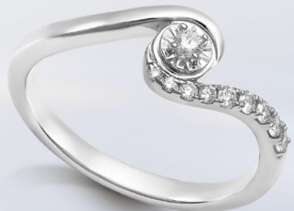
Nhẫn GNDDDDW013128 14.549.000Đ

Giá bán tham khảo, có thể thay đổi tùy theo trọng lượng sản phẩm