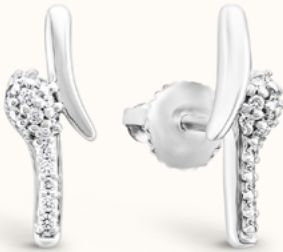
Bông tai GBDD00W060210 11.750.000Đ