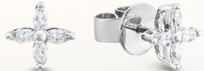
Bông tai GBDD00W060213 22.430.000Đ