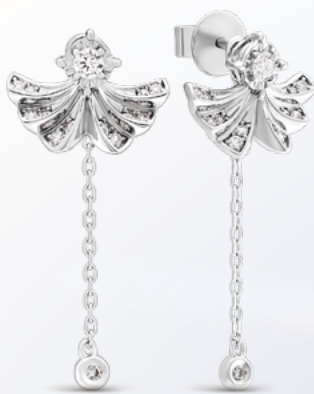
Bông tai GBDDDDW004416 30.095.000Đ