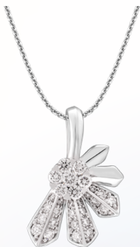
Mặt dây chuyền GMDDDDW002776 50.810.000Đ