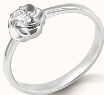
Nhẫn GNDD00W000395 12.173.000Đ