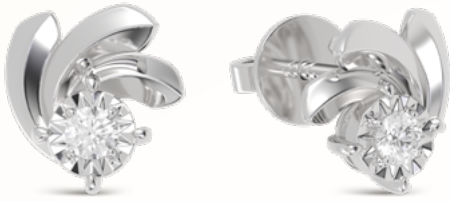
Bông tai GBDD00W001963 15.807.000Đ