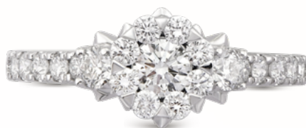
Nhẫn GNDDDDW013464 42.690.000Đ