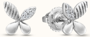
Bông tai GBDD00W060189 9.130.000Đ