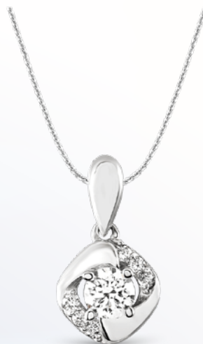
Mặt dây chuyền GMDDDDW000337 17.782.000Đ