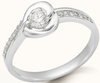
Nhẫn GNDDDDW000935 21.630.000Đ