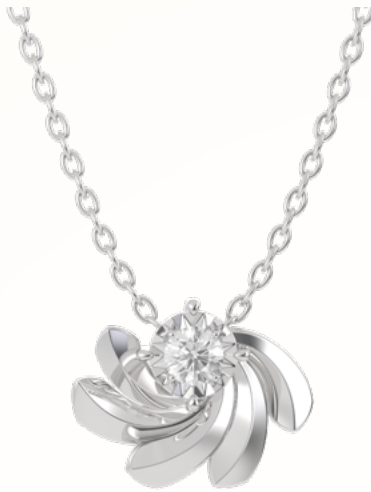
Dây chuyền GCDDDDW000800 32.100.000Đ