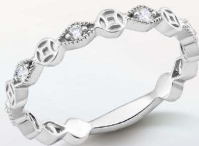
Nhẫn GNDD00W060466 12.830.000Đ