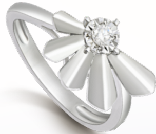
Nhẫn GNDD00W005826 14.851.000Đ