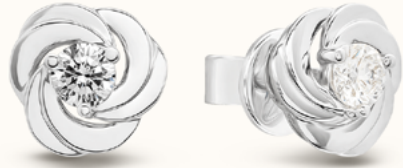
Bông tai GBDD00W000320 22.573.000Đ