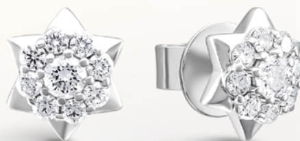
Bông tai GBDDDDW004574 22.239.000Đ