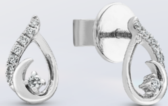
Bông tai GBDDDDW060443 8.220.000Đ

Thiết kế tinh giản gợi nên cảm giác trẻ trung, thời thượng cho nàng dễ dàng mix&match với nhiều outfit.