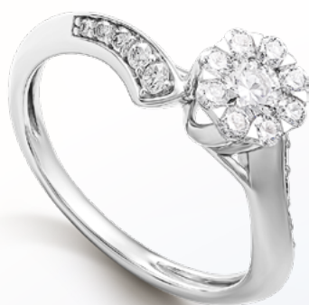
Nhẫn GNDDDDW013465 39.079.000Đ