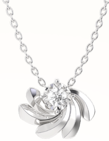
Dây chuyền GCDD00W000457 24.852.000Đ