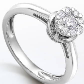
Nhẫn GNDDDDW013465 39.079.000Đ