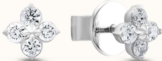
Bông tai GBDDDDW004574 22.239.000Đ