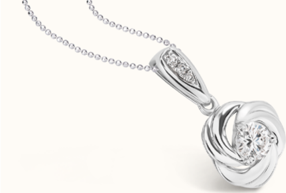
Mặt dây chuyền GMDDDDW000355 17.431.000Đ