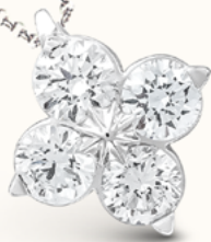
Mặt dây chuyền GMDD00W000738 11.248.000Đ