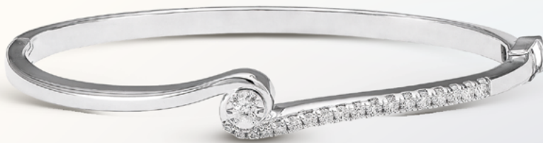
Vòng tay GVDDDDW001082 53.976.000Đ