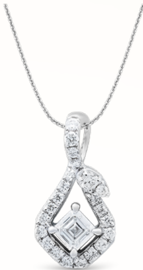
Mặt dây chuyền GMDDDDW002975 23.0?????Đ