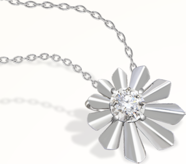
Mặt dây chuyền GMDD00W000706 23.614.000Đ