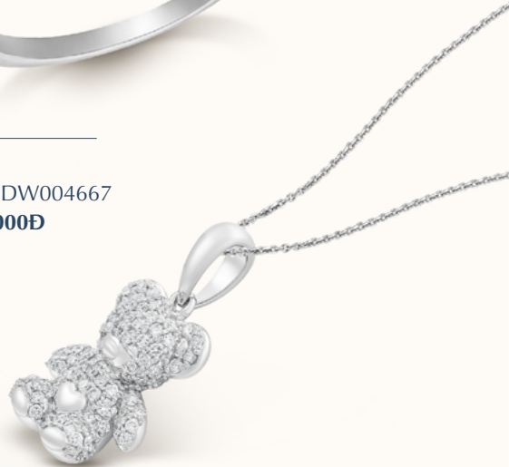
Mặt dây chuyền GMDDDDW002972 26.842.000Đ