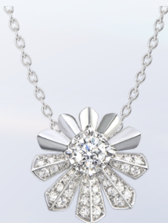
Mặt dây chuyền GMDD00W000706 40.240.000Đ