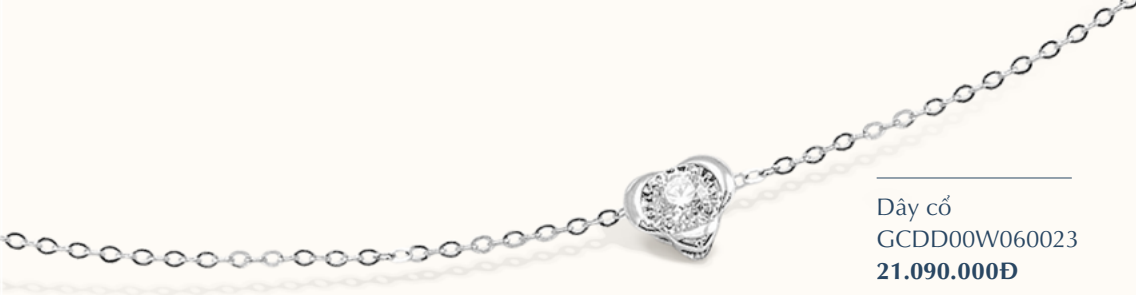
Dây cổ GCDD00W060023 21.090.000Đ