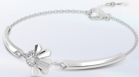
Lắc tay GLDDDDW000909 24.332.000Đ