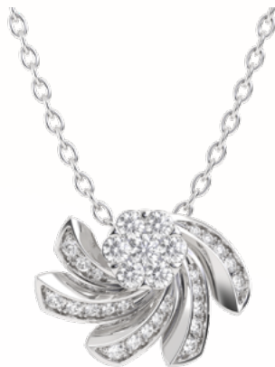
Dây chuyền GCDDDDW000781 31.795.000Đ