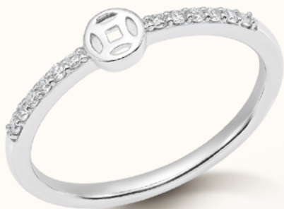
Nhẫn GNDD00W006266 10.688.000Đ