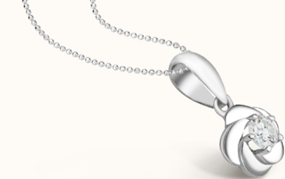
Mặt dây chuyền GMDD00W000124 7.983.000Đ