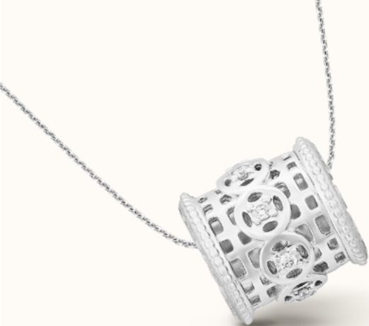
Mặt dây chuyền GMDD00W000736 12.268.000Đ

Hoạ tiết kim tiền đan lồng vào nhau, gợi mở những điều tươi sáng và vẹn tròn.