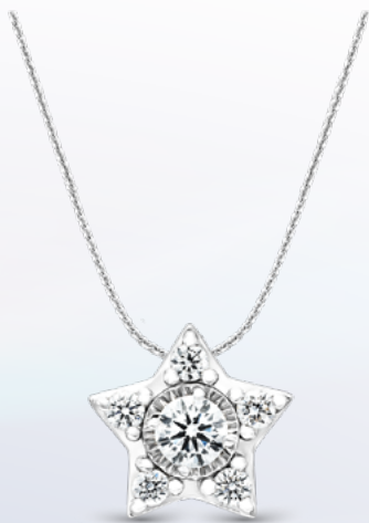
Mặt dây chuyền GMDDDDW002968 9.403.000Đ