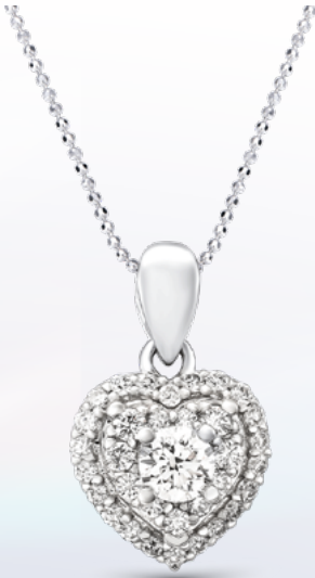
Mặt dây chuyền GMDDDDW000423 31.820.000Đ