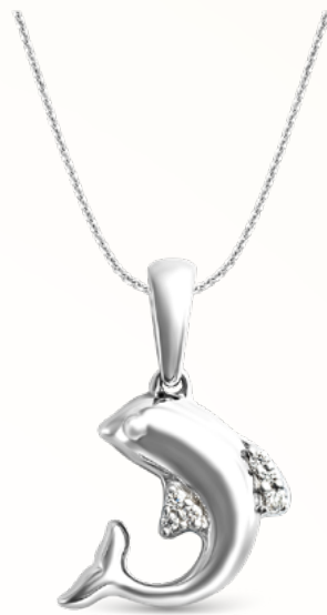
Mặt dây chuyền GMDDDDW060410 9.540.000Đ