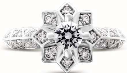
Nhẫn GNDDDDW013463 65.281.000Đ