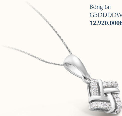
Mặt dây chuyền GMDD00W060085 7.290.000Đ