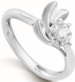
Nhẫn GNDD00W005827 20.503.000Đ