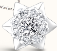
Mặt dây chuyền GMDDDDW002921 17.916.000Đ