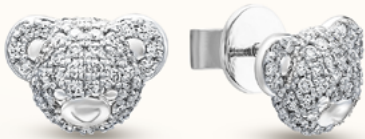
Bông tai GBDDDDW004667 30.947.000Đ