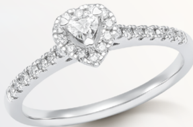
Nhẫn GNDDDDW015469 25.257.000Đ