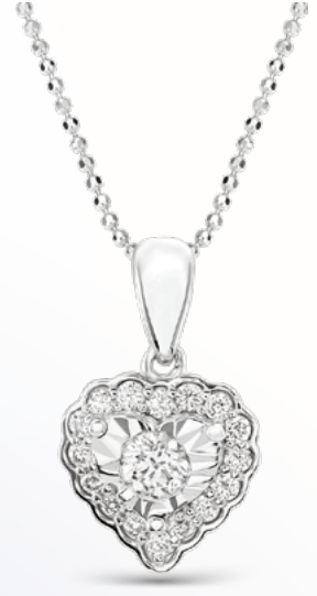
Mặt dây chuyền GMDDDDW000923 23.267.000Đ

Giá bán tham khảo, có thể thay đổi tùy theo trọng lượng sản phẩm