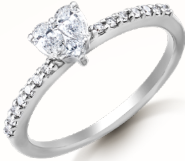
Nhẫn GNDDDDW013463 65.281.000Đ