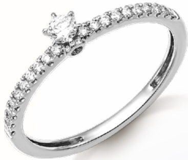
Nhẫn GNDDDDW013463 65.281.000Đ