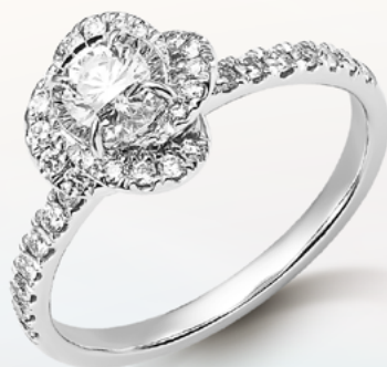
Nhẫn GNDDDDW060679 42.120.000Đ