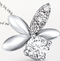
Mặt dây chuyền GBDDDDW001408 20.963.000Đ