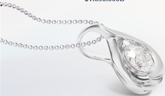
Mặt dây chuyền GMDD00W000134 11.561.000Đ