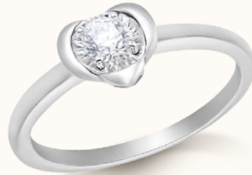
Nhẫn GNDD00W060476 21.090.000Đ