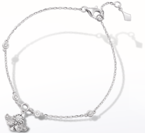
Lắc tay GLDDDDW000920 19.889.000Đ