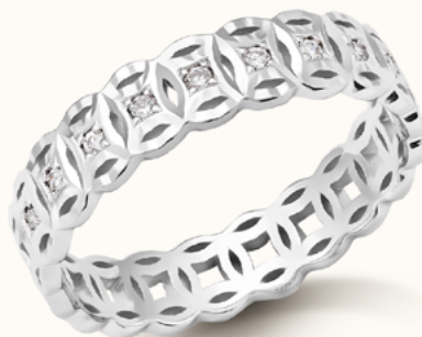
Nhẫn GNDD00W005272 17.060.000Đ