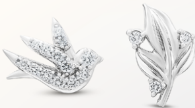
Bông tai GBDDDDW004666 14.497.000Đ