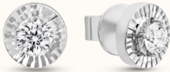
Bông tai GBDD00W001905 25.638.000Đ