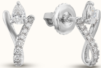
Bông tai GBDDDDW060429 12.920.000Đ

Thiết kế tinh giản hòa cùng Kim cương tinh tuyển, gợi ý cho nàng ghi điểm với phong cách thanh lịch.