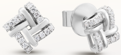
Bông tai GBDD00W060200 12.920.000Đ