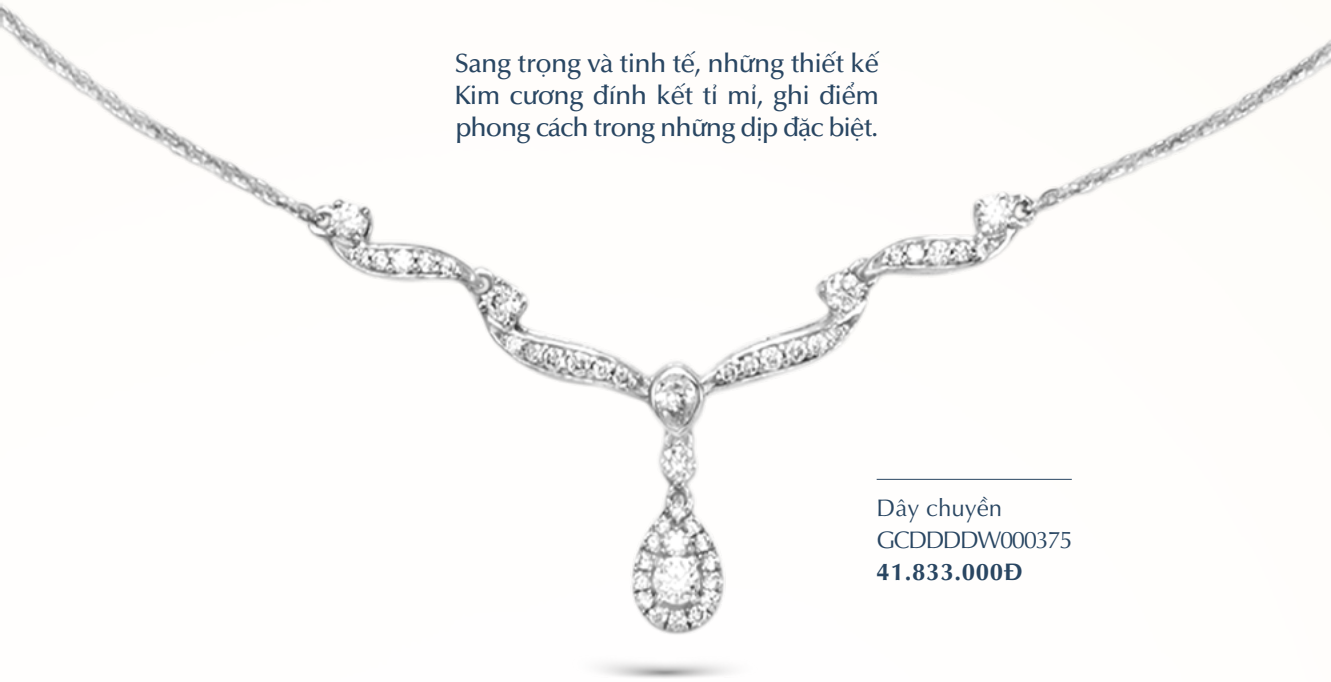
Dây chuyền GCDDDDW000375 41.833.000Đ

Sang trọng và tinh tế, những thiết kế Kim cương đính kết tỉ mỉ, ghi điểm phong cách trong những dịp đặc biệt.