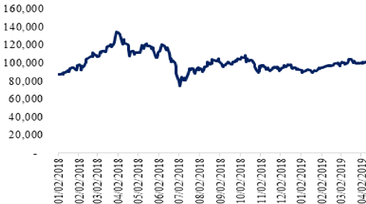
Diễn biến giá cổ phiếu PNJ