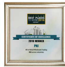
GIẢI THƯỞNG JNA